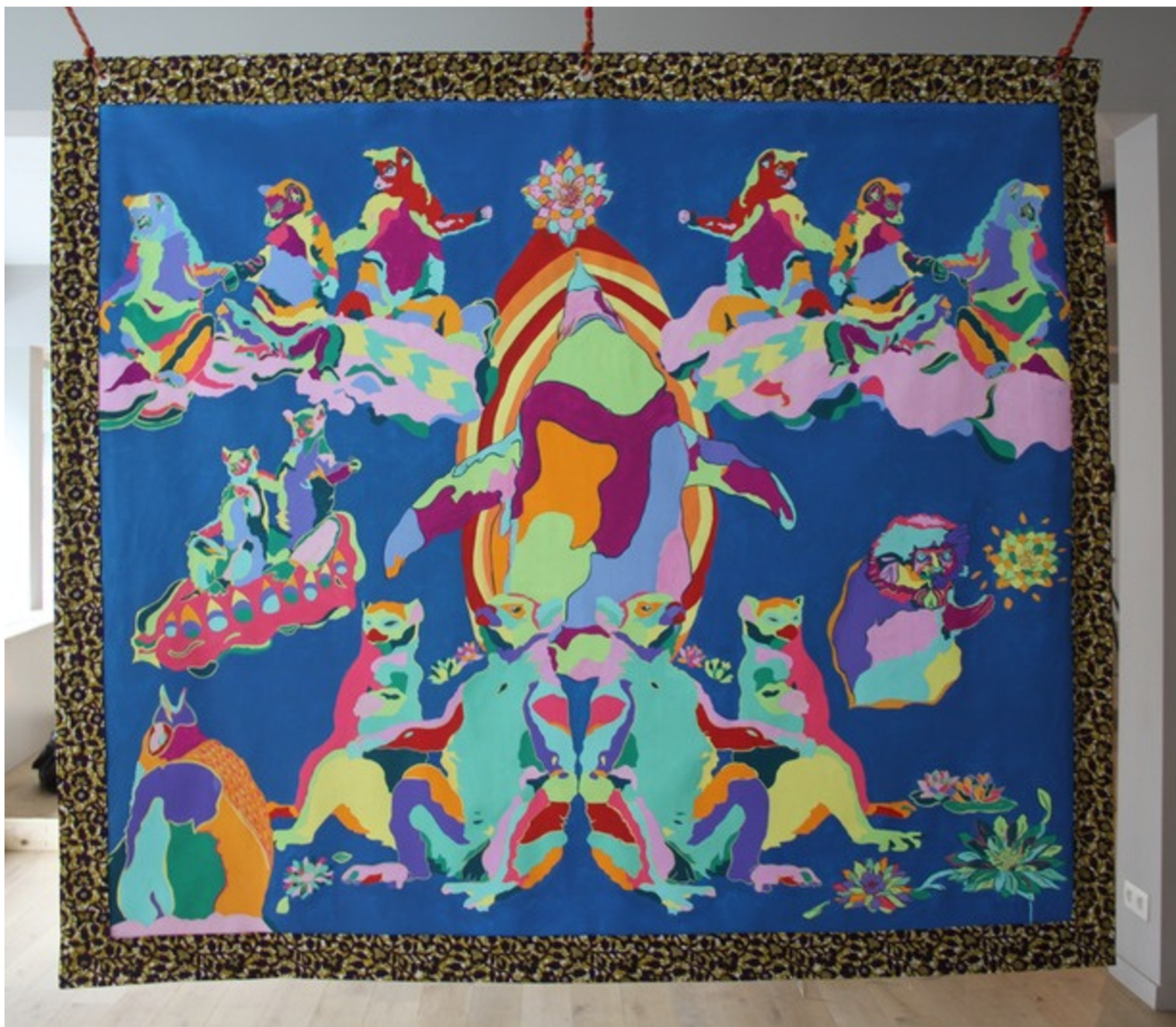
Transfiguration animale , 2018 gauche, peinture Paon-lin sur coton, 180*190 cm

Chaque matin, les lémuriens prennent un bain de soleil afin d'avoir suffisamment d'énergie pour aller chasser. C'est aussi une activité de douceur sociale.