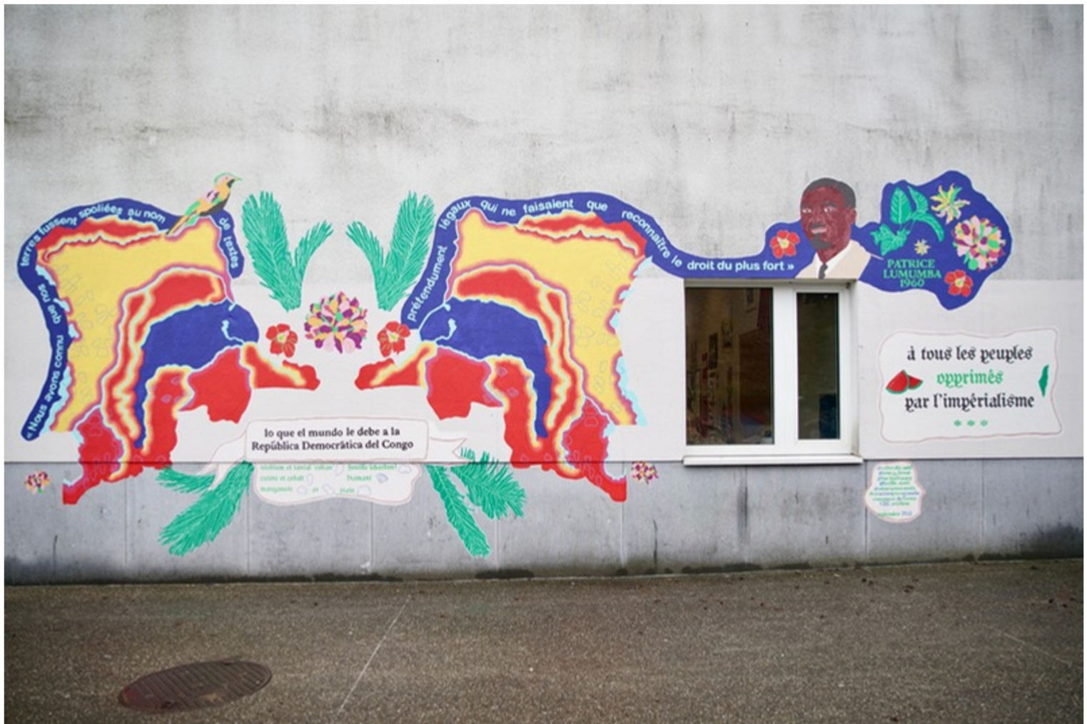
Lo que el mundo le debe a la República Democrática del Congo, 2025 peinture murale, sur un mur extérieur de l'asbl Amour et Sagesse , 350*850cm Diversity, Bruxelles