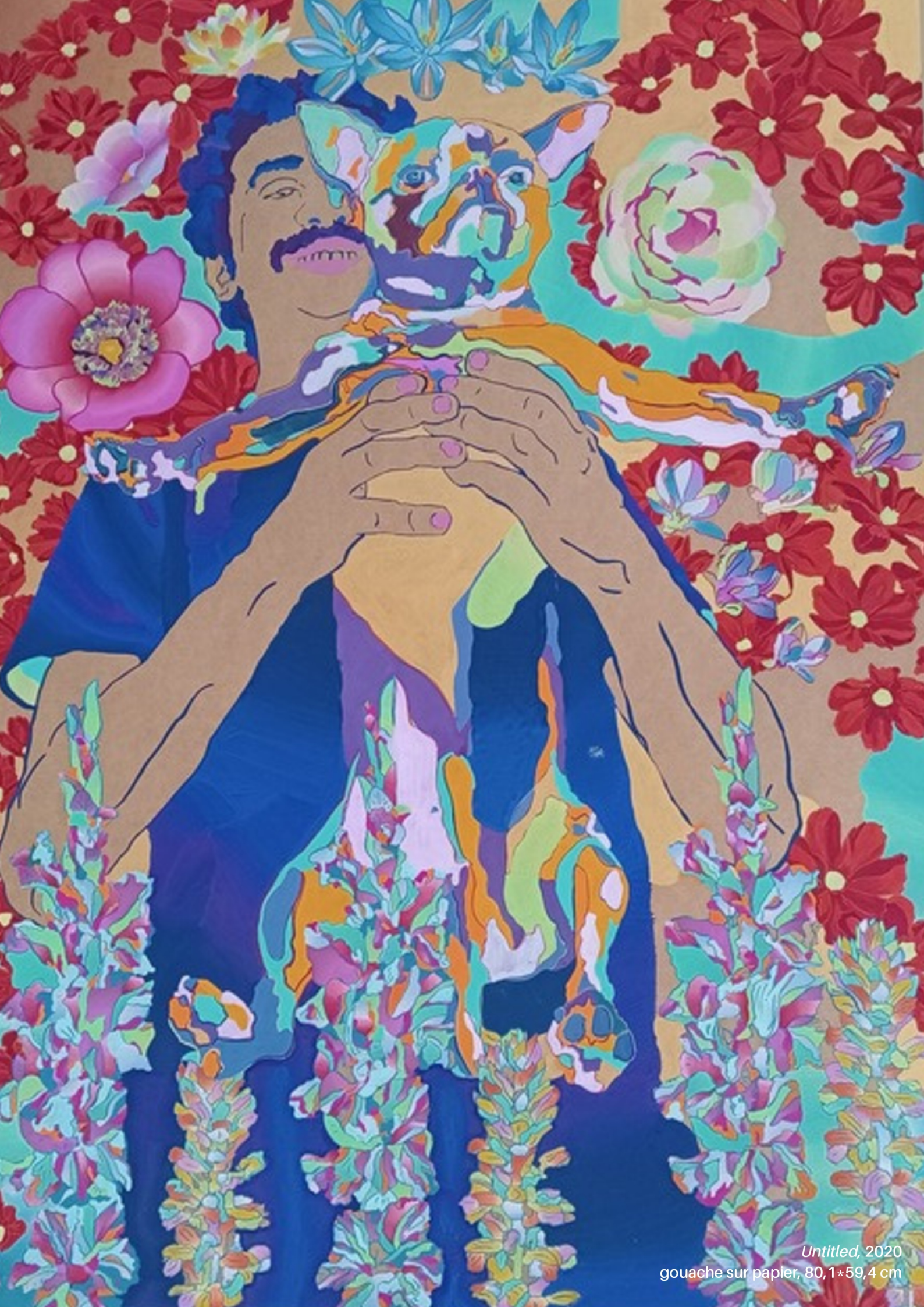
Untitled, 2020 gouache sur papier, 80,1*59,4 cm