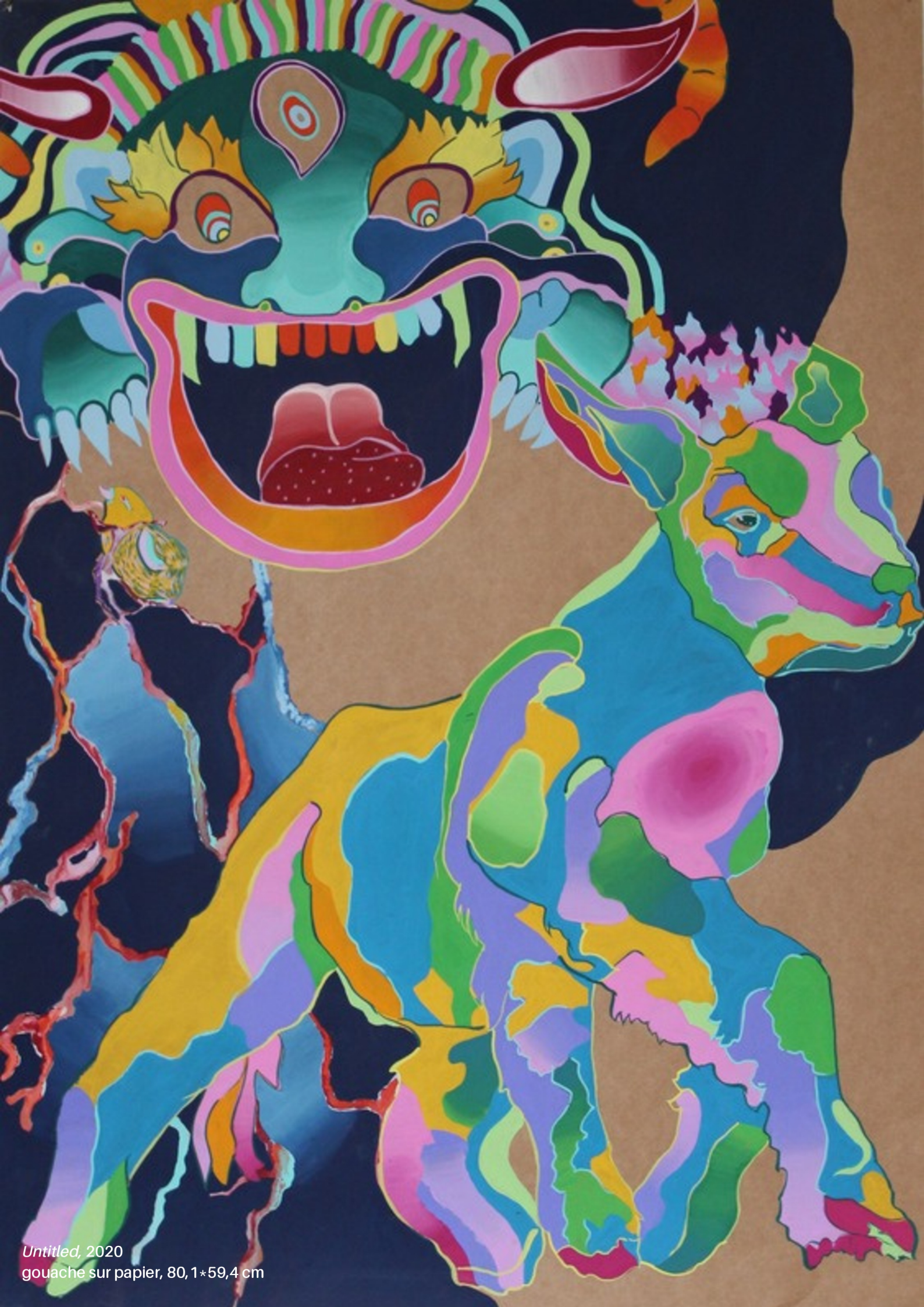
Untitled, 2020 gouache sur papier, 80,1*59,4 cm