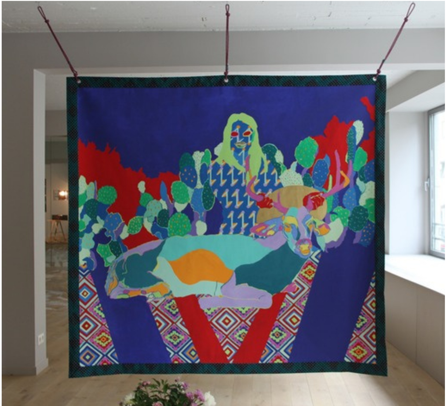
La mort du cerf sacré : Au plaisir de Kendall Jones, 2017 gauche, peinture Paon-lin sur coton, 200*210 cm