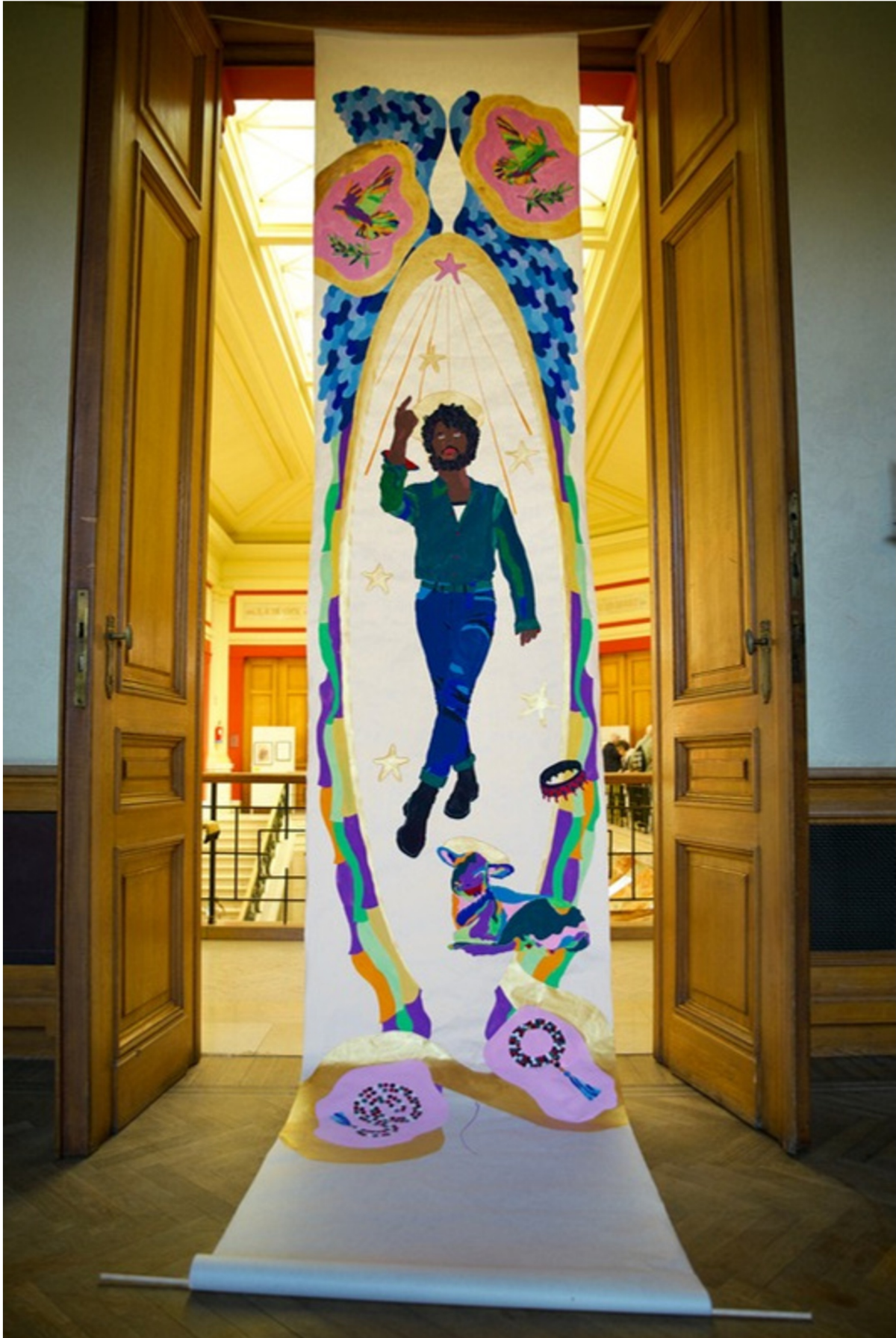
Saint Jean Baptiste, 2024

projet in-situ dans la Commune de Molenbeek