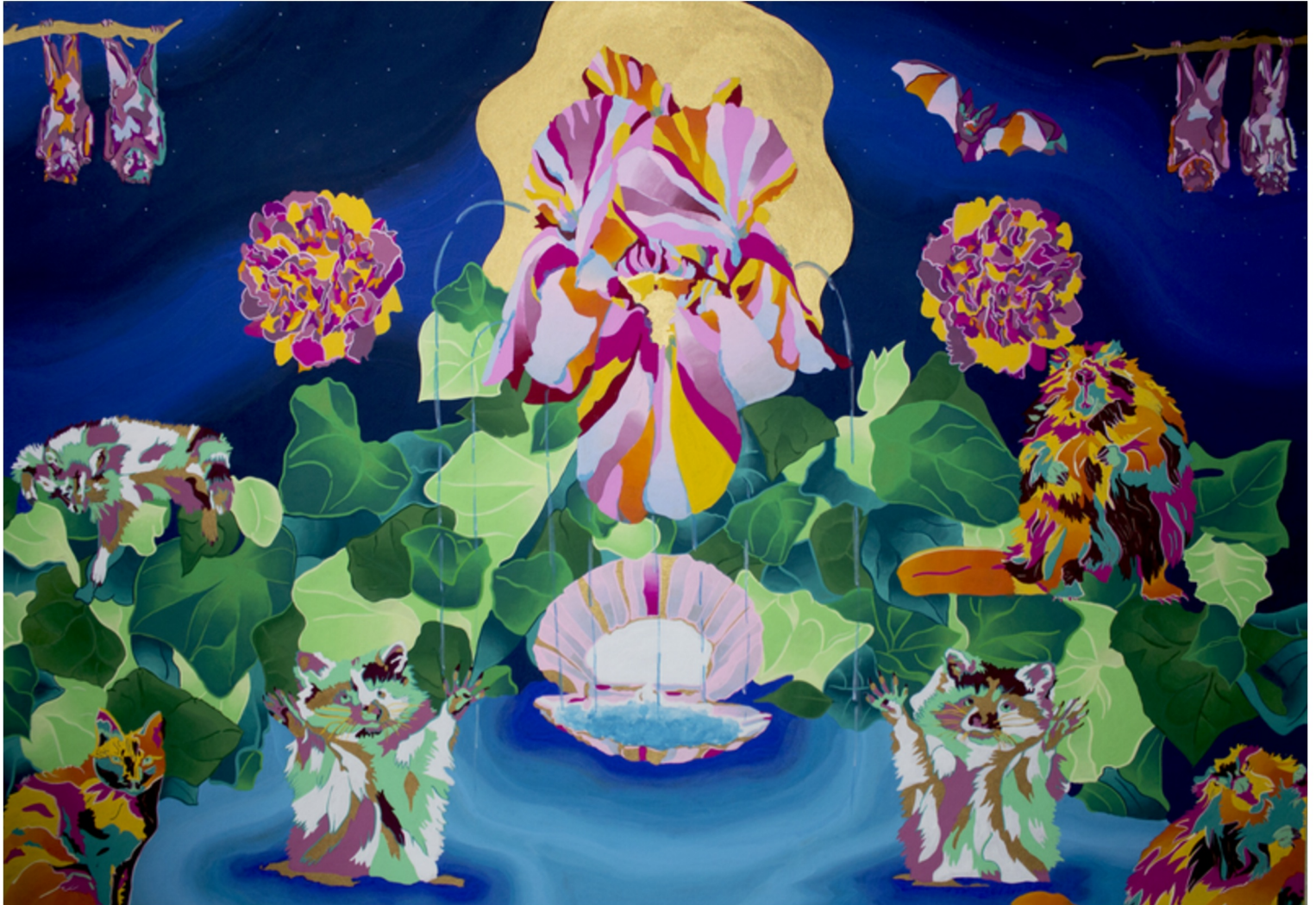
Pleasure, 2024 gouache sur papier, 59,4*80,1 cm