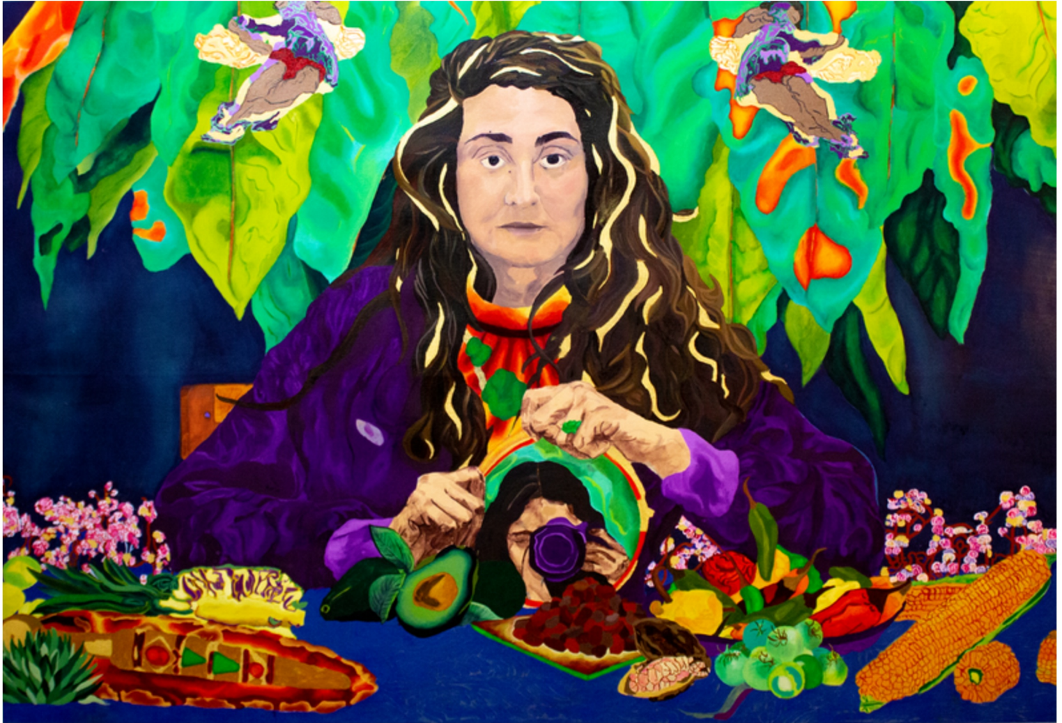
Autoportrait ou dysmorphie généralisée, 2025 huile sur coton, 120*150 cm sélectionnée pour l'exposition I am here - je suis là - ik ben hier, Espace Vanderborght, Avril - Mai 2026